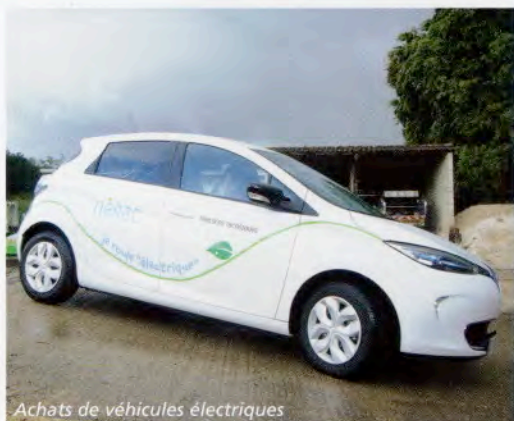
Achats de véhicules électriques