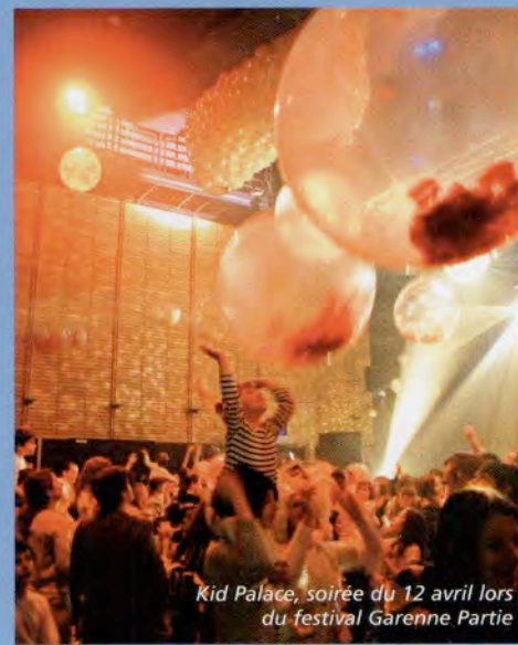
Kid Palace, soirée du 12 avril lors du festival Garenne Partie

La seconde édition de l'éco-festival de Nérac a eu lieu du mardi 9 au dimanche 15 avril. Plus de 8000 personnes ont participé à cet événement, que ce soit les enfants des écoles, collèges et lycées en temps scolaire, les spectateurs venus aux représentations en salle ou en extérieur, les bénévoles, les familles ayant hébergé les équipes artistiques, les sportifs qui ont participé aux épreuves du Défi du dimanche, les personnes venues assister aux différentes conférences organisées sur la thématique du développement durable, les danseurs du flashmob, les naturalistes en herbe, les partenaires de la manifestation. Le fil conducteur de la Garenne Partie demeure le plaisir de vivre ensemble un moment de partage !