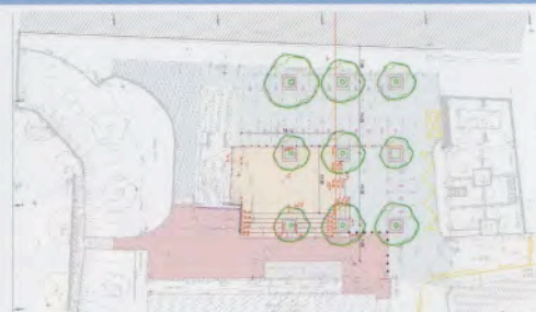
Projet d'aménagement de la place de la cale haute