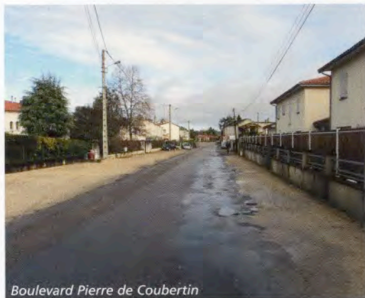
Boulevard Pierre de Coubertin